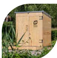
LIBRE Die öffentliche Kabine

Kontakt Finizio GmbH Ostender Höhen 70 16225 Eberswalde