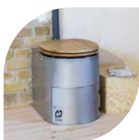
LILOO Die Indoor-Toilette

Bei der Fukuoka handelt es sich um ein Manufakturprodukt! Leichte Abweichungen in der Form und an Schweißnähten sind möglich, da jedes Einzelstück in Handarbeit gefertigt wird.