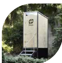
EGON Die mobile Kabine